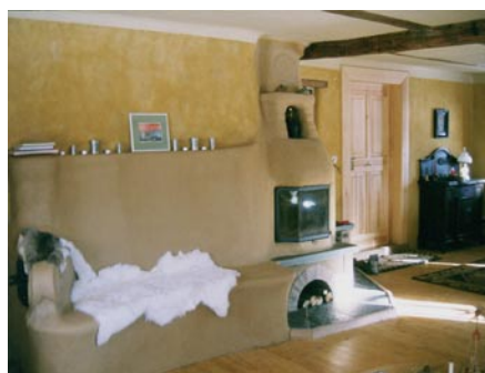
ehemaliges Wohnzimmer mit historischer Holzeinschubdecke