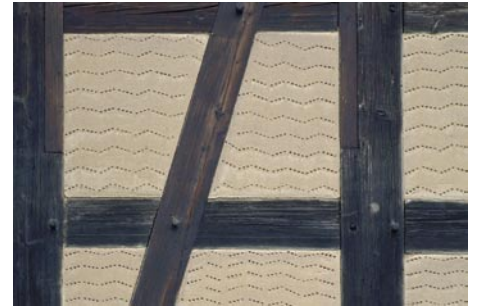
Lehmaußenputz mit Stippmuster

Alle verwendeten Lehmbauteile wurden auf der Baustelle oder in der näheren Umgebung in Eigenleistung angefertigt.