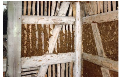
Reparatur der Lehmgefache

Nutzfläche: 280 m 2 Baukosten: ~300 000 € Wärmeverbrauch: 77,5 kWh/m 2 /Jahr